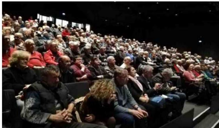
Le théâtre Cravey a fait le plein samedi après-midi pour l'assemblée générale de l'Addufu.