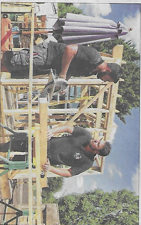
Image des Journées du Patrimoine : d'abord au Natus avec les usagers de la forêt et sur le port avec l'association Samapapor.

Entre les quatre murs de la cabane Burden, siège de l'association,